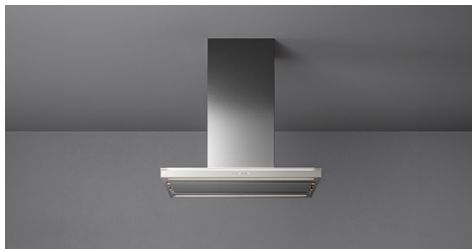
Снимката е само за информация Може да не отговаря на избрания модел